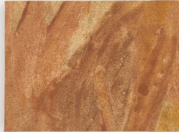
Irene Grau A hierro. 30x40#3

2024 Óxido de hierro y agua de río sobre lienzo 30 x 40 cm