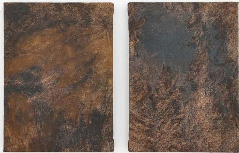
Irene Grau A hierro. 40x30#4-#5

2024 (díptico) Óxido de hierro y agua de río sobre lienzo Dimensiones variables