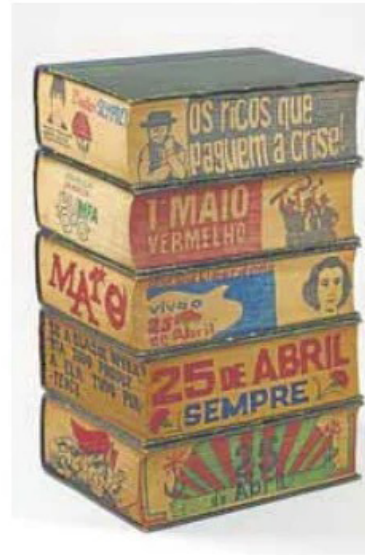
'Povo Unido' y 'A poesia está narua', dos de las piezas. NUNES-FERREIRA

“Tan nuevo y tan cerca”, que podrá verse hasta el 27 de marzo, se acompaña de un texto realizado por el comisario Hugo Dinis y cuenta con el apoyo de la Embajada de Portugal en España. Ya en su recta final, hasta el 3 de febrero, la galería acoge la colectiva ‘Cuarto de invitados,’ en su quinta entrega, y desde el día 8 dará cabida a la obra