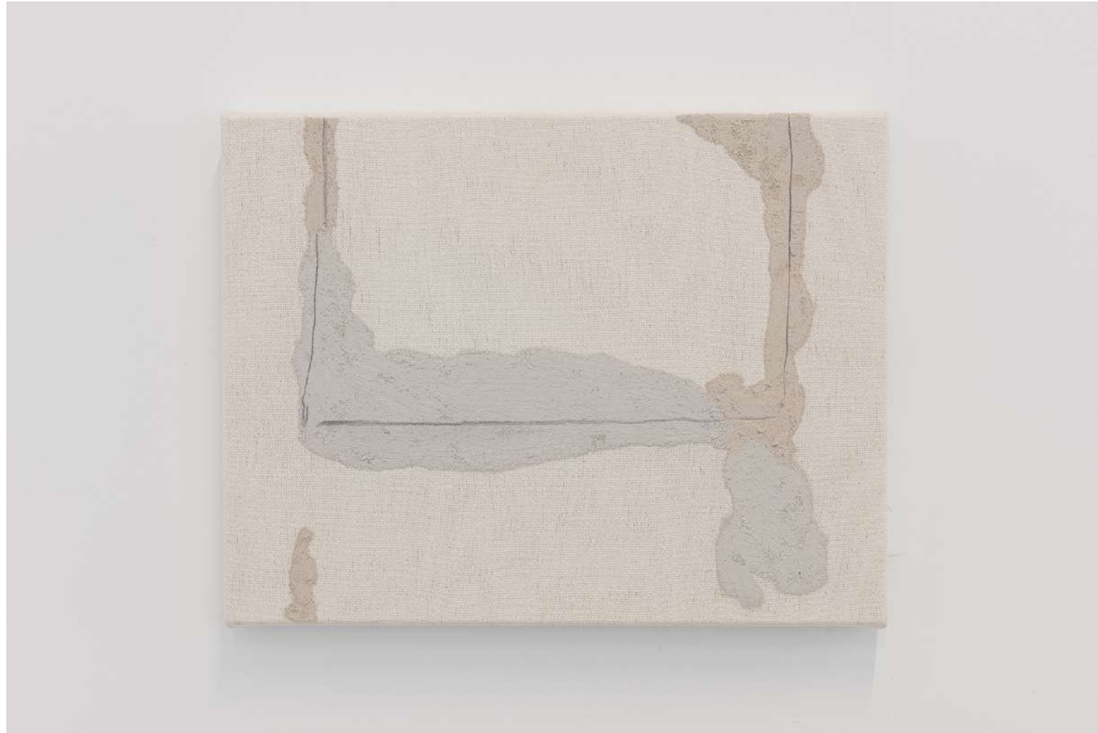
Irene Grau 3mm. 27x35#4

2022 Granito, mármol y grafito sobre lienzo 27 x 35 cm