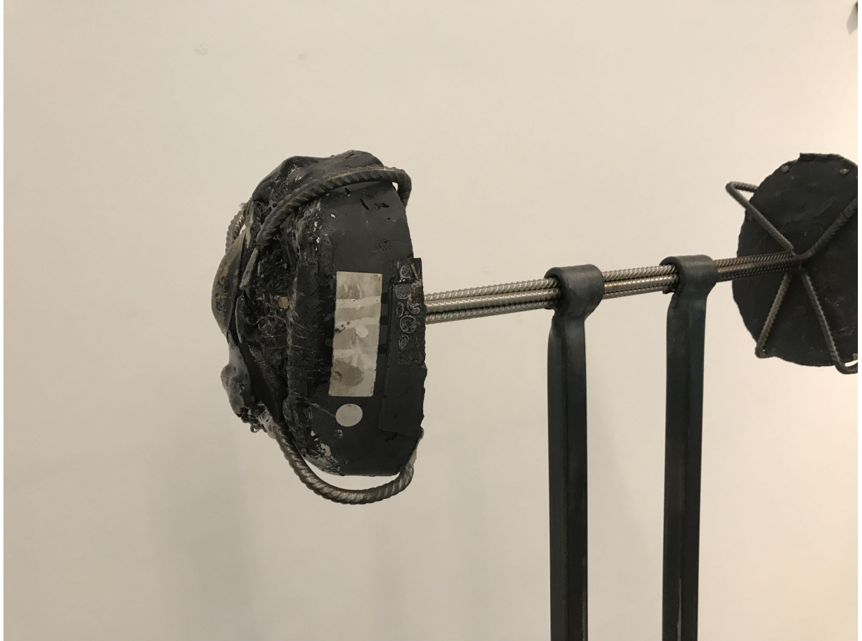
Foto detalle 2