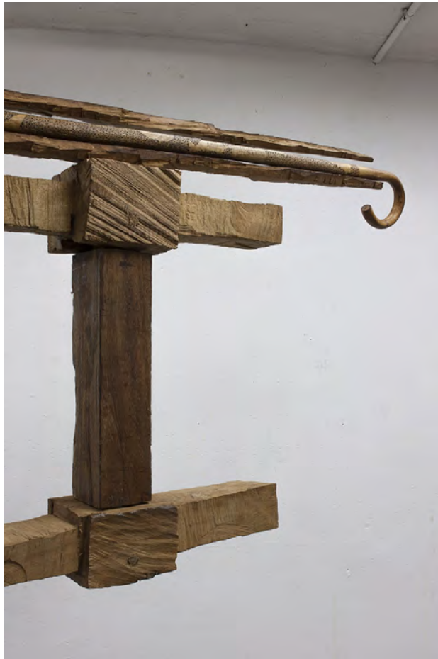
Foto detalle 2