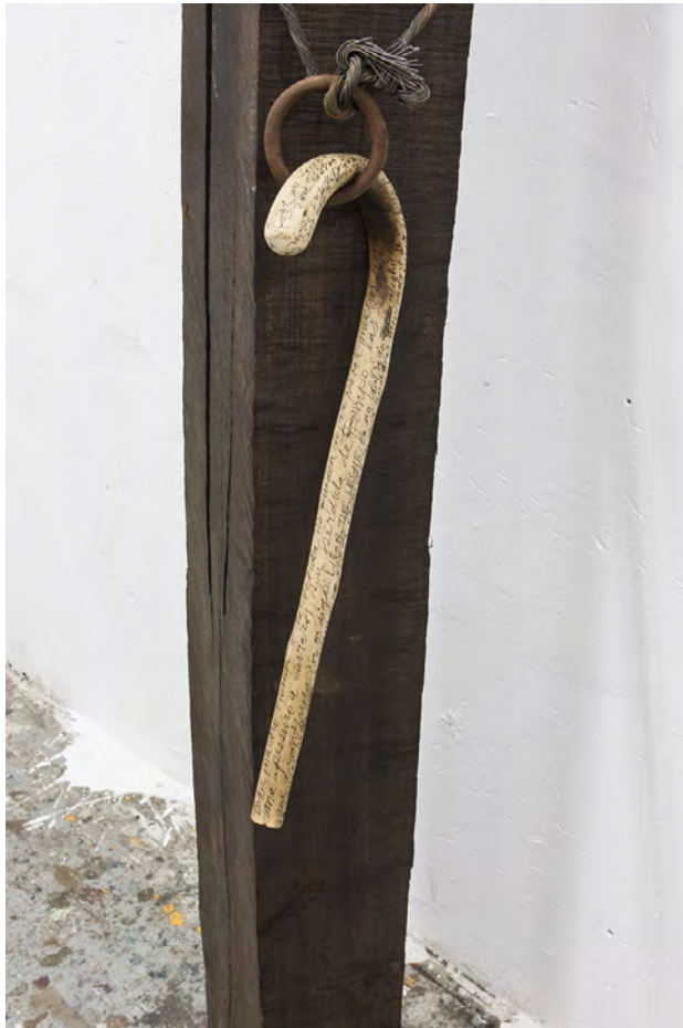
Foto detalle 2