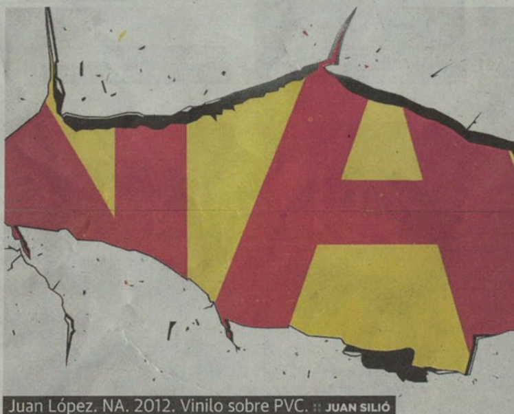
Juan López. NA. 2012. Vinilo sobre PVC. :: JUAN SILIÓ

era modificar el texto para lanzar mensajes de ánimo y no vender nada al espectador. Ahora, en estas nuevas obras, la idea es la de asumir la tipografía como forma, estableciendo una relación más directa entre