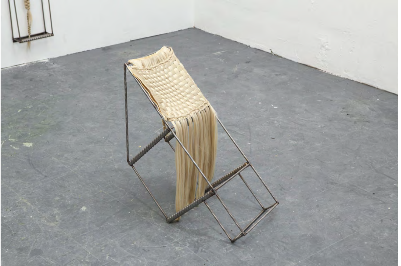
aulki bat - Nora Aurrekoetxea