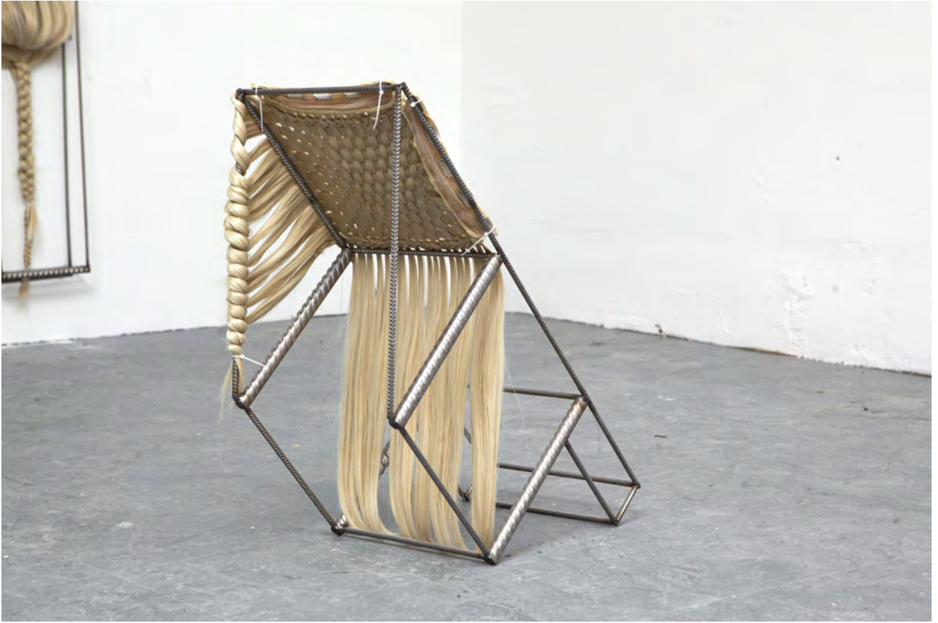
aulki bat - Nora Aurrekoetxea